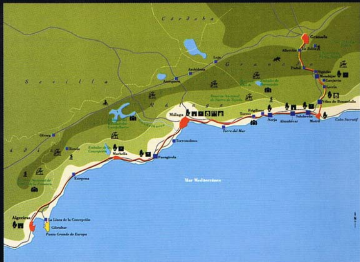
Ruta de al-Idrisi